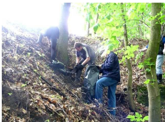
Likvidace skládky na Dubecku spolupráci s asociací geocachingu