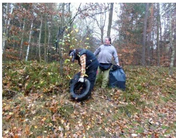
Likvidace divoké skládky na pomezí PRČeskou Klokočské skály a PR Podloučky -listopad 2013