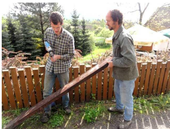
Oprava posezení v obci Klokočí -místní části Rotštejn - květen 2013

V roce 2013 se dobrovolníkům povedlo zlikvidovat 2divoké skládky- jednu na jaře v lokalitě Dubecko ve spolupráci s Obecním úřadem v Mírové pod Kozákovem a druhou ,velkou, vespolupráci se Správou CHKO Český Ráj na rozhraní PR Klokočské skály a Podloučky počátkem listopadu . Opravit se povedlo schodiště k jeskyni Postojná a část stezky poškozené srpnovým přívalovým deštěm v areálu Rotštejna.