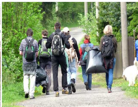
Povrchový sběr odpadků v rezervaci ve spolupráci s Českou asociací geocachingu