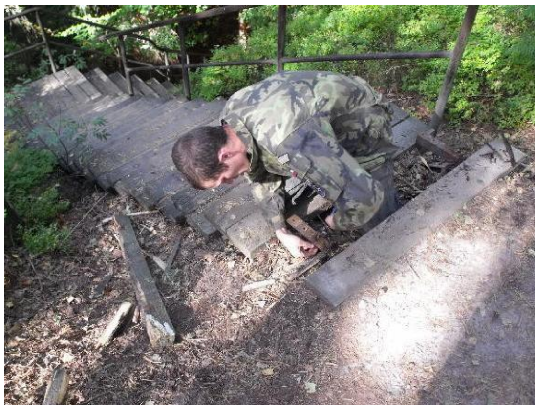
Oprava schodiště vedoucího k Postojné - říjen 2013