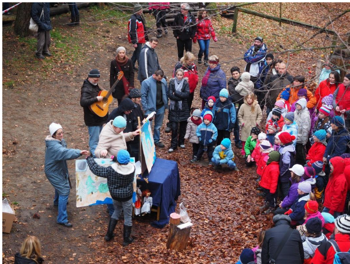
Z veselého hradního koledování

Hrad se stal prodejním místem pilotního projektu – Sestav si svůj geopark – v rámci spolupráce s vedením geoparku Český ráj a nakladatelstvím Vega -L.